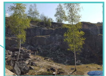
Pelouse calcaire « Les Roches »