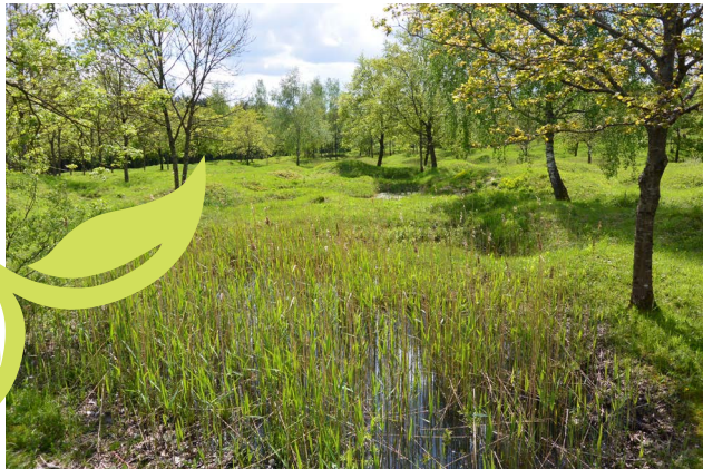
Vestiges de l'ouvrage de Thiaumont à Fleury-devant-Douaumont