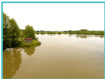
Étang des Bercettes