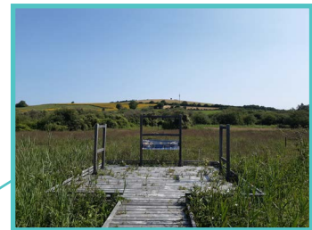
Marais de Chaumont