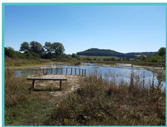
Ballastières de Damvillers