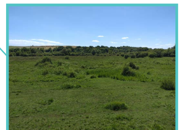
Marais de Pagny