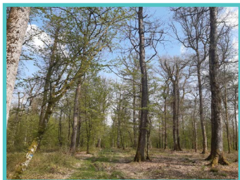
Massif forestier de « Jeand'Heurs » et ses sources karstiques