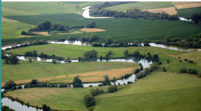
La vallée de la Meuse