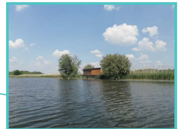
Étang de Perroi