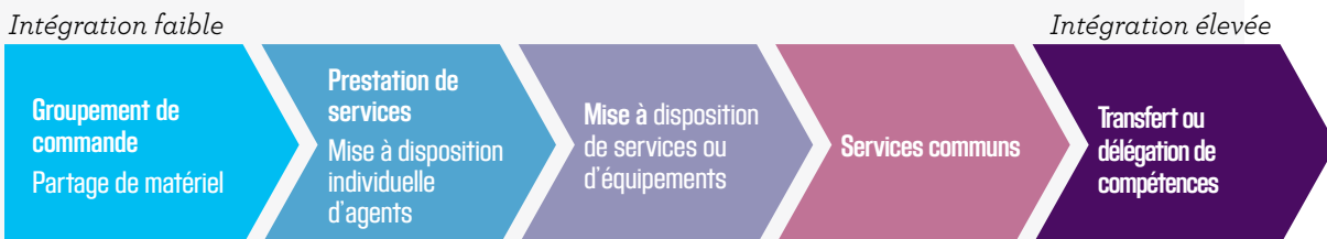
Fig.1 – Degrés de mutualisation de services

Le transfert de compétences constitue la forme la plus aboutie de «mutualisation de services», concept beaucoup plus vaste qui peut aller de la simple mise à disposition à des formes de coopération beaucoup plus poussées (ententes, mise en œuvre de services communs ou partagés...).